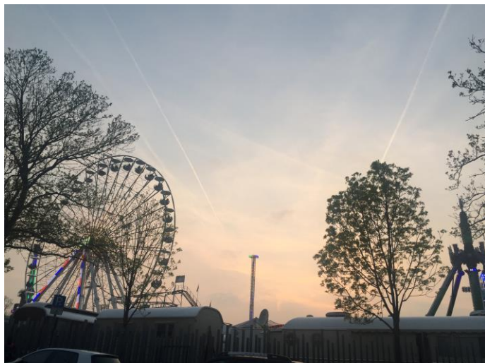
(圖六)阿亨 Bendplatz 遊樂園