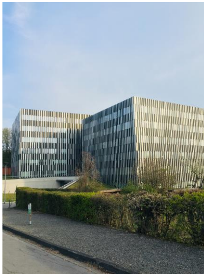
(圖四)電機系館外觀